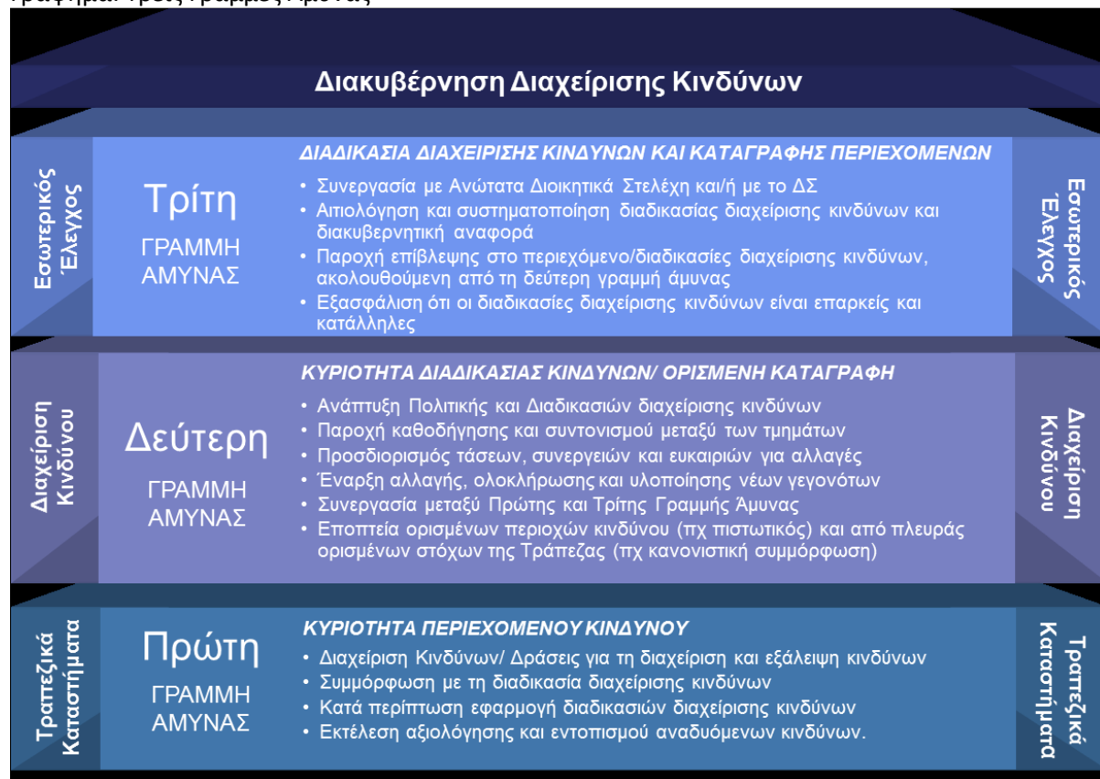
Γράφημα: Τρεις Γραμμές Άμυνας

Η Διεύθυνση Εσωτερικής Επιθεώρησης και η Διεύθυνση Διαχείρισης Κινδύνων δεν συμμετέχουν στη λήψη επιχειρησιακών αποφάσεων και τα μέλη που τις απαρτίζουν δεν έχουν κανενός είδους σχέση με τα υπόλοιπα διοικητικά στελέχη της Τράπεζας, εξασφαλίζοντας την εύρωστη, εύρυθμη και διαφανή περάτωση των καθηκόντων τους.